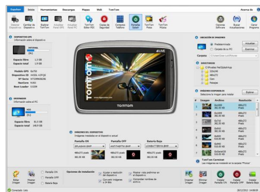
Figura 4.2 – Dispositivo conectado y detectado